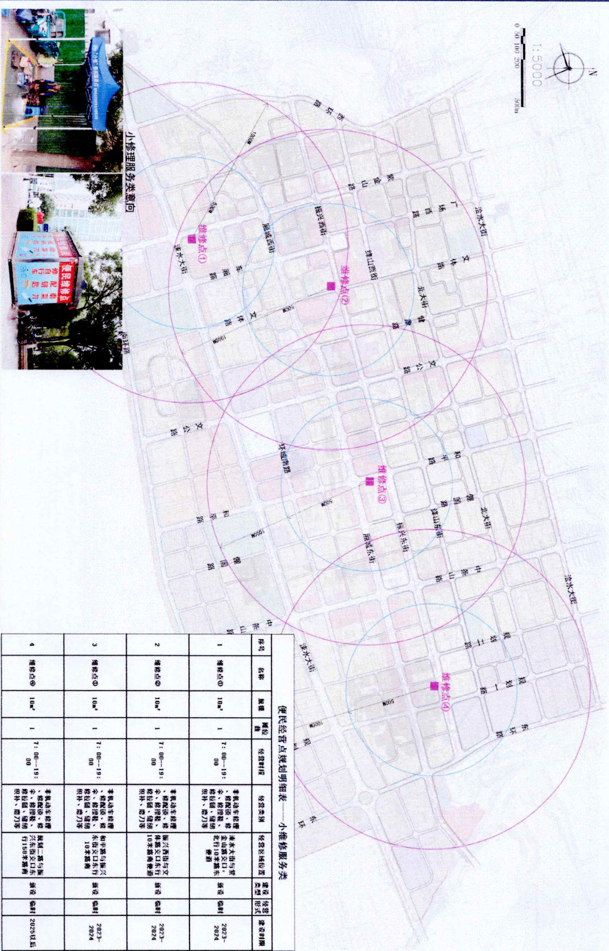
便民经营点规划明细表——小维修服务类