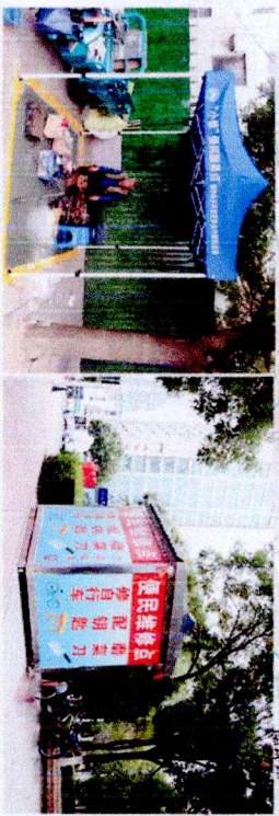
小修理服务类意向