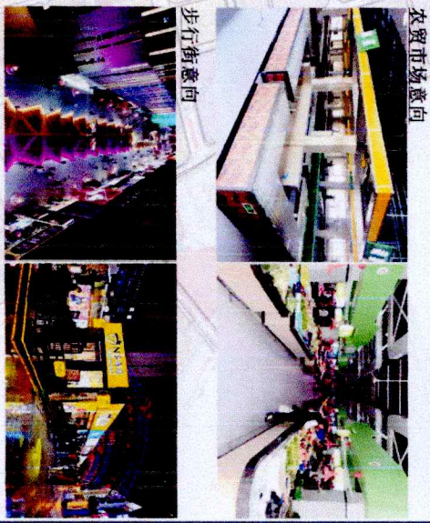
便民经营点规划明细表——便民市场类